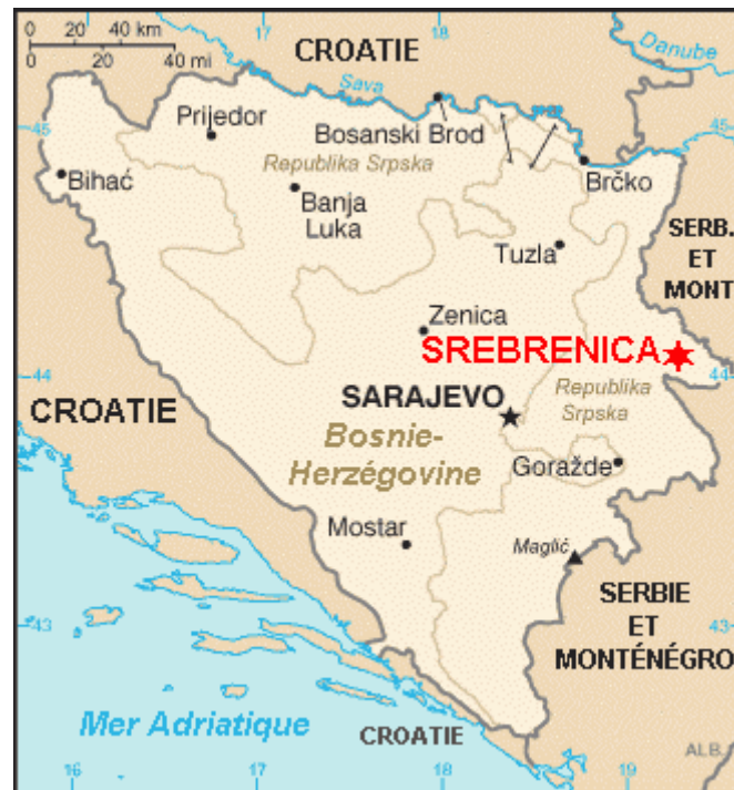
1. ábra: Bosznia-Hercegovina entitásai Dayton után

nagyjából négy millió lakossal és öt hatósági szinttel rendelkezik.” (saját fordítás) (Európai Bizottság, 2021)